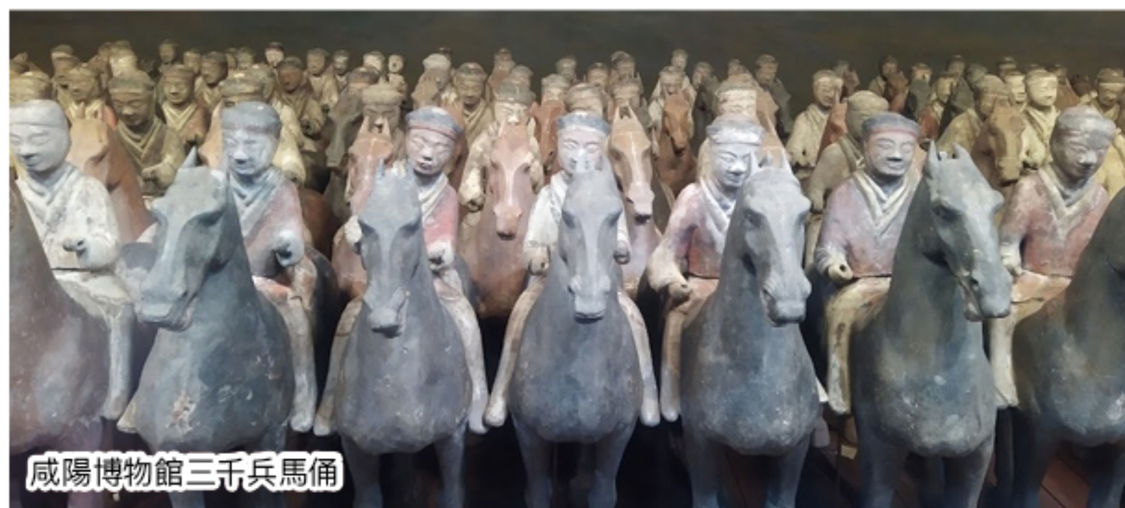
咸陽博物館三千兵馬俑

西安機場在咸陽市，西安人每每興建大型基建都小心翼翼，怕拾遺地下文物還沒發現。如興建咸陽機場時，便發現了地下埋藏着漢景帝及皇后的合葬陵園「漢陽陵」，只能再把選址西遷。說起漢陽陵，又是一個著名的兵馬俑，雖然沒有按秦兵馬俑 1:1 建造。不過陪葬陵園是十分宏大，數以千計的彩繪裸體陶俑，每位包括士兵、侍女陶俑的表情、身型，甚至眼、耳、口和鼻都刻畫清楚，甚至包括性器官，以在外蓋上絲綢衣服，有如今今天玩的芭比娃娃。另外有樂伎和舞蹈者的陶俑，反映君王相信壽終到另一個世界生活也不忘娛樂。