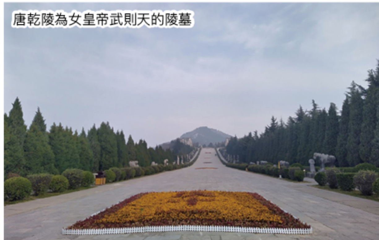
唐乾陵為女皇帝武則天的陵墓

秦朝秦始皇所在的都城咸陽，人口有 500 萬，全市文物點超過五千個，古墓葬一千個，古建築更超過 200 個，整個城市沉浸在歷史中。小小的咸陽博物館內盡是中國國寶級文物，當中有迷你的西漢三千彩色兵馬俑，保存良好，二千年後顯現在大家眼前。