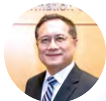
政府資訊科技總監 辦公室助理政府資訊 科技總監(產業發展) 黃敬文先生